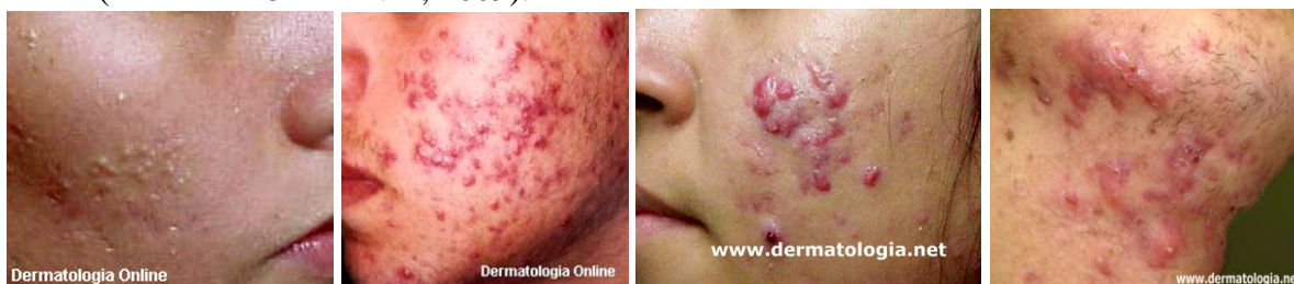
Graus da acne: I, II, III e IV